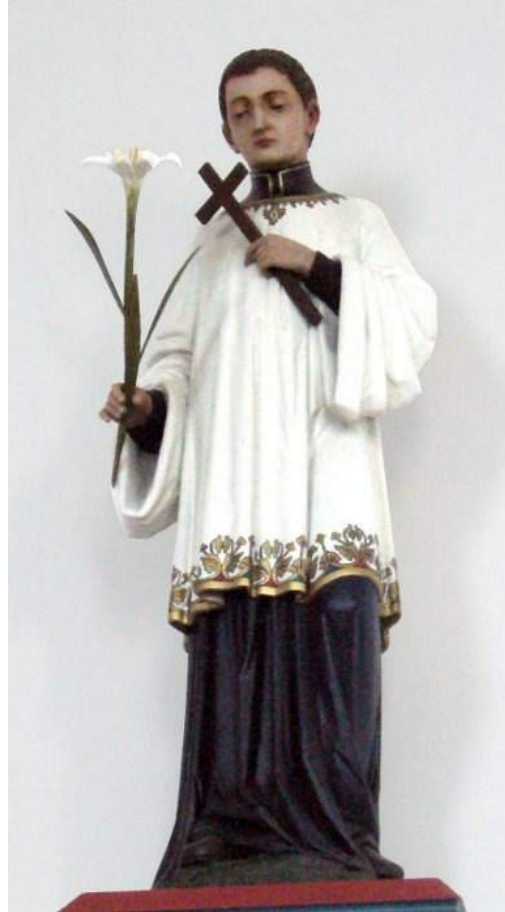
ECCE SANCTUS ALOYSIUS ADHUC NASO INTEGRO INSTRUCTUS !

Tum Friedmannus: »Haec coniugatio«, inquit, »nequaquam nobis pensa est discenda«